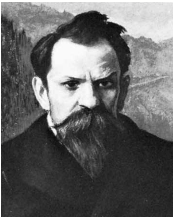
Stefan Żeromski, pastel by Leon Wyczółkowski, 1904; in the National Museum, Kraków, Poland.

Stefan Żeromski herbu Jelita (ur. 14 października 1864 w Strawczynie, zm. 20 listopada 1925 w Warszawie) – polski prozaik, publicysta, dramaturg, nazwany "sumieniem polskiej literatury"; wolnomularz; pierwszy prezes Polskiego PEN Clubu.